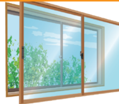
今ある窓のみ【単板ガラス3mm】